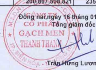
Trần Hưng Lương