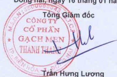
Trần Hưng Lương