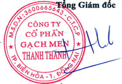
Trần Hưng Lương