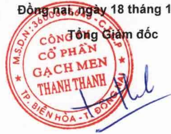
Trần Hưng Lương